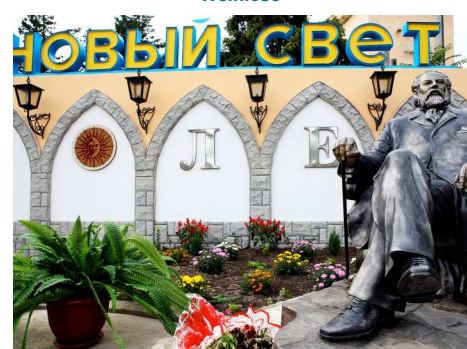
Novij Swet, Lew Golizyn Denkmal