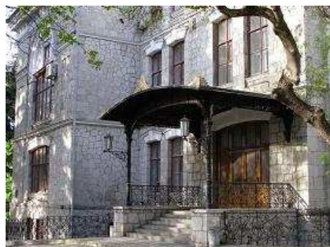
Das Institut für Weinbau „Magaratsch“

Die Weine von Inkerman werden u.a. nach Russland, Polen, USA und Deutschland exportiert.